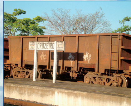
Chafariz no centro de Cruzeiro e Estação de Cruzeiro